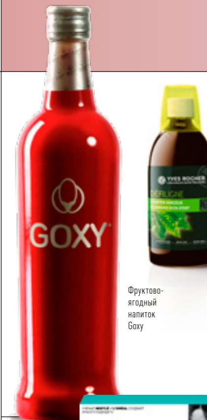
Фруктово-ягодный напиток Goxy