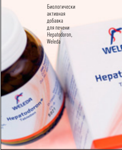
Биологически активная добавка для печени Hepatodoron, Weleda